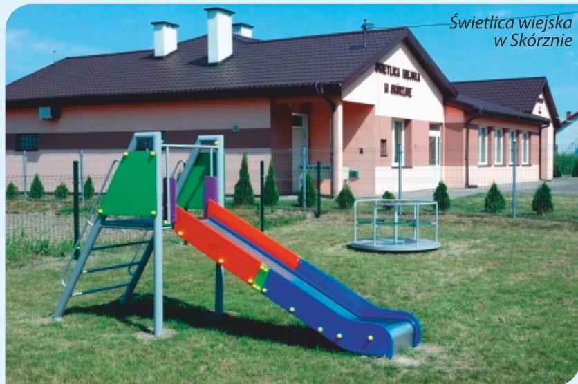
Świetlica wiejska w Skórznie

dobrzyńskiej (według Herbarza polskiego Adama Bonieckiego). Wieś liczyła wówczas 4 łany, istnieją też wzmianki o funkcjonującej karczmie. W 1775 r. Fabianki liczyły 16 domostw zamieszkałych przez 84 osoby.