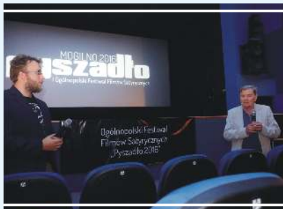
Ogólnopolski Festiwal Filmów Satyrycznych PYSZADŁO

Zapraszamy również do odwiedzenia kina Wawrzyn , znajdującego się przy ul. ks. Piotra Wawrzyniaka. Kameralna atmosfera i ciekawy repertuar zostanie doceniony przez miłośników kina. Od 2007 r. przy kinie działa Mogileńska Akademia Filmowa, w ramach której wyświetlane są filmy przeznaczone przede wszystkim dla ambitnego kinomana. W gminie organizowane są także liczne imprezy cykliczne, wśród których warto wymienić m.in.: Ogólnopolski Festiwal Filmów Satyrycznych PYSZADŁO, Mogileńskie Spotkania Plastyczne, Dni Benedyktyńskie, piknik „Chlebem i Miodem”, „Gwiazdkowe Pierniki”, Złot Miłośników Militariów i Pojazdów Ratowniczych czy Rajd Weteranów Szos po Ziemi Mogileńskiej.