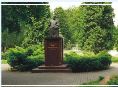
Pomnik ks. Piotra Wawrzyniaka

Ratusz przy ul. Narutowicza 1 to budynek z przełomu XIX i XX w., eklektyczny, nawiązujący swą formą do zamków zachodnioeuropejskich.