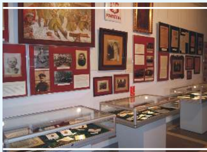
Muzeum Ziemi Mogileńskiej w Chabsku

W odległości ok. 5 km od Mogilna warto odwiedzić Muzeum Ziemi Mogileńskiej w Chabsku . Placówka gromadzi zabytki związane z dziejami oraz kulturą ziemi mogileńskiej, przynależnej geograficznie do Wielkopolski, leżącej na pograniczu Kujaw i Pałuk.