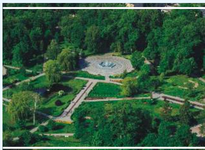
Park miejski w Mogilnie

Park miejski wraz z amfiteatrem i otoczeniem położony jest w centralnej części miasta, będąc jednocześnie charakterystycznym i wyróżniającym elementem przestrzeni Mogilna. W parku znajduje się amfiteatr letni z 300 miejscami dla widzów. Obiekt wykorzystywany jest podczas organizowanych latem koncertów czy imprez plenerowych. Nieopodal amfiteatru znajduje się fontanna, która swą stylistyką nawiązuje do Mogilna poprzez wkomponowanie w jej kształt elementu herbu miasta, czyli 3 skrzyżowanych krzyży.