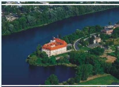
Klasztor Zakonu Braci Mniejszych Kapucynów

w Polsce kamienna studnia z XI w. głęboka na 8 metrów. Od 1 stycznia 2014 r. klasztor zamieszkuje Bracia Mniejsi Kapucyni Prowincji Warszawskiej.