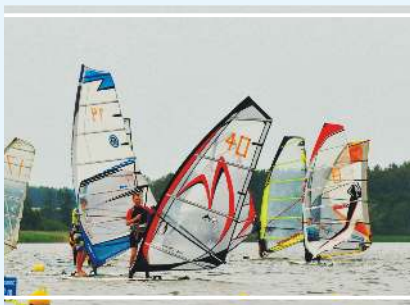
Regaty na Jeziorze Wiecanowskim

Plaża Wiecanowo to miejsce, które zostało zmodernizowane i oddane do użytku w 2013 r. Od tego czasu cieszy się dużym powodzeniem i popularnością podczas sezonu letniego. Na terenie obiektu znajdują się: 3 boiska do siatkowej piłki plażowej, wypożyczalnia kajaków i rowerów wodnych, sprzętu sportowego i rekreacyjnego oraz leżaków, wodna atrakcja dla dzieci z torem przeszkód, punkty gastronomiczne, toalety, pole namiotowe z udostępnionym prysznicem, stojaki na rowery, parking z wydzielonymi miejscami dla osób niepełnosprawnych. Nad bezpieczeństwem pływających zawsze czuwają wykwalifikowani ratownicy.