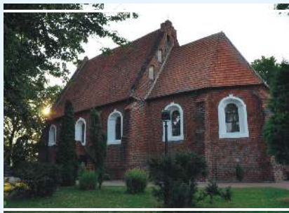
Kościół św. Jakuba Apostoła (fara)

Kościół farny - historia mogileńskiej fary sięga 1145 r. W obecnej, gotyckiej formie kościół pod wezwaniem św. Jakuba istnieje od XVI w. Jest to jednonawowa budowla o trójbocznie zamkniętym prezbiterium. Na ścianie głównego ołtarza późnogotycki krucyfiks z 1511 r. Ołtarze boczne w stylu rokoka powstały w XVIII wieku. W zachodniej kruchcie kripelnicza z początku XVI w. Przy kościele dzwonnica z przełomu XVIII/XIX w. z dzwonami z 1580 i 1936 r. Obok lipa drobnolistna – pomnik przyrody. Godnym uwagi zabytkiem jest także parterowa plebania z pierwszej połowy XIX w.