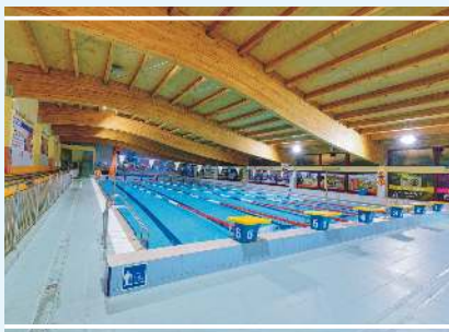
Kryta pływalnia w Mogilnie

Hala widowiskowo-sportowa jest obiektem przeznaczonym do zajęć sportowych i organizowania imprez masowych. Wysokość hali w najniższym punkcie wynosi 12,50 m, co umożliwia rozgrywanie meczów o charakterze międzynarodowym. Trybuny przewidziano dla 880 osób, z podziałem na 14 sektorów, do których dostęp zapewniony jest z poziomu piętra. W pobliżu hali przy ul. Mickiewicza znajduje się 2-gwiazdkowy Hotel Mogilno, w którym dostępnych jest 12 pokoi dwuosobowych o wysokim standardzie i w atrakcyjnej cenie.