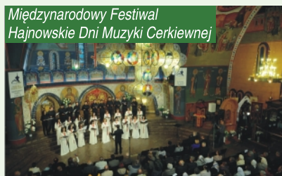
Międzynarodowy Festiwal Hajnowskie Dni Muzyki Cerkiewnej