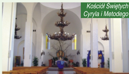
Kościół Świętych Cyryla i Metodego

Kościół pw. Podwyższenia Krzyża Świętego – obiekt sakralny, w murach którego znajdują się unikatowe, zabytkowe 28 głosowe organy z wrocławskiej pracowni firmy „Schlag und Söhne”, wykonane na przełomie XIX i XX wieku. Pięknego brzmienia ich dźwięków można posłuchać podczas Koncertów Muzyki Kameralnej i Organowej, które odbywają się w wakacje w naszym mieście.