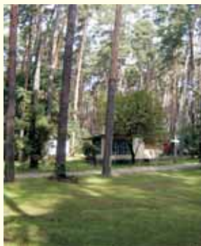
Ośrodek wypoczynkowy w Szczutowie