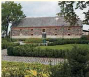
Zabytkowy spichlerz. Gmina Rościszewo