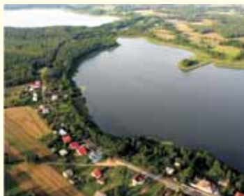
Jezioro Szczutowskie i Urszulewskie z lotu ptaka