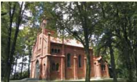
Sanktuarium Matki Boskiej w Żurawinie