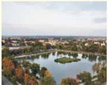
Panorama Sierpcu