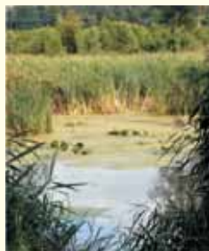
Rzeka Skrwa w Nadolniku