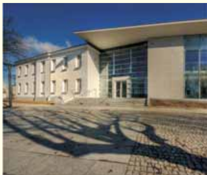
Centrum Kultury i Sztuki w Sierpcu