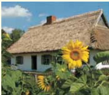
Chatka na Skansenie