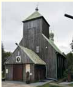
Kościół parafialny w Lukomiu