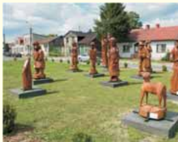
Rzeźby wykonane podczas pleneru w roku 2015. Zawidz Kościelny

The centre of the Old Town is characterised by old buildings on the outskirts of two markets. At a small Old Market Square there is a City Hall which was built in a classical style in years 1840-1841 and which was intended to be a municipal office (until 1970). It remained in the unchanged external condition to this day. At the turn of 1843 and 1844 a wooden tower with a clock which was later destroyed was added to a building. A new clock was installed on the tower in summer 1997 and in 1999 it was enriched by a bugle call the inauguration of which took place at midnight in 2000. At present, City Hall is the seat of Mazovian Countryside Museum where, among others, museum lessons, exhibitions and parties for children and teenagers related to St. Andrew's Day take place. Moreover, a wooden house built in the 18th century, commonly known as „Kasztelanka” is characterised by one of the most beautiful architectural forms.