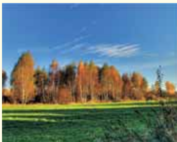
Krajobraz - okolice Zawidza Kościelnego