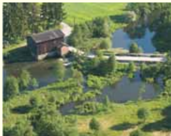
Młyn wodny w Choczeniu wraz z groblą

Centrum Starego Miasta charakteryzuje stara zabudowa na obrzeżach dwóch rynków. Przy niewielkim Starym Rynku stoi ratusz, który wybudowany został w stylu klasycystycznym w latach 1840-1841 i przeznaczony na siedzibę władz miejskich (do 1970 roku). W stanie zewnętrznie niezmiennym zachował się do dnia dzisiejszego. Na przełomie 1843 i 1844 roku dobudowano drewnianą wieżyczkę z zegarem, która później uległa zniszczeniu. Nowy zegar został zamontowany na wieżyczce latem 1997 roku, a w 1999 wzbogacono o hejnał miejski, którego uroczysta inauguracja odbyła się o północy 2000 roku. Obecnie ratusz jest siedzibą Muzeum Wsi Mazowieckiej w Sierpcu, gdzie odbywają się m.in.: lekcje muzealne, wystawy, wieczory andrzejkowe dla dzieci i młodzieży. Jedną z najpiękniejszych form architektonicznych odznacza się dom drewniany wzniesiony w XVIII wieku, zwany powszechnie „Kasztelanką”.