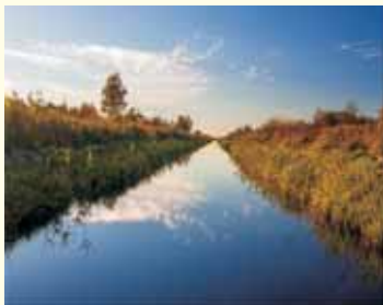
Rzeka Raciążnica - okolice Zawidza