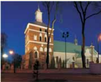
Kościół Farny w Sierpcu