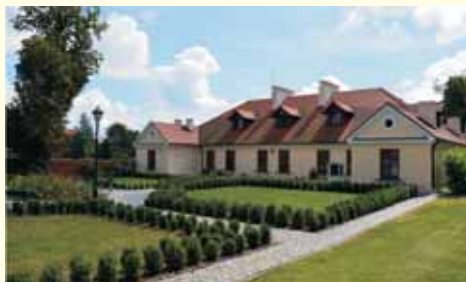
Dwór w Rościszewie - siedziba Urzędu Gminy