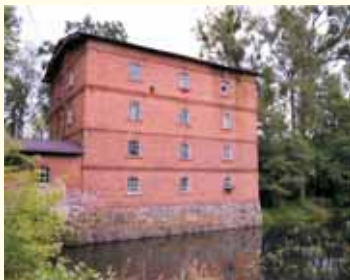
Młyn Wodny w Mieszczku