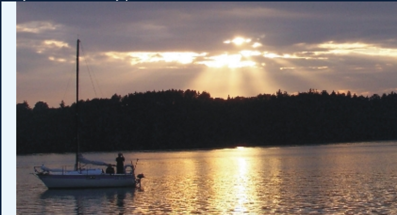
Jeziro Lipie wieczorową porą