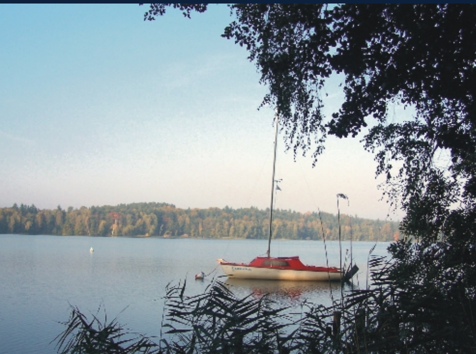
Jezioro Lipie w Długiem