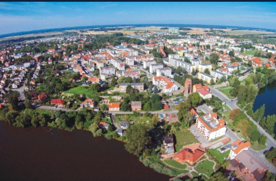
Strzelce Krajeńskie z lotu ptaka

Ziemia strzelecko-krajeńska położona jest w północno-wschodniej części województwa lubuskiego, w powiecie strzelecko-drezdeneckim i stanowi jeden z ciekawszych obszarów tej części kraju. Dzięki swemu położeniu na pograniczu wysoczyzny pomorskiej i pradoliny Noteci region posiada niezwykle urozmaiconą rzeźbę terenu.