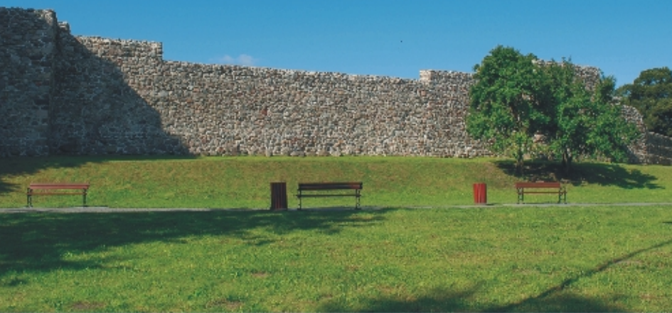
Średniowieczne mury obronne