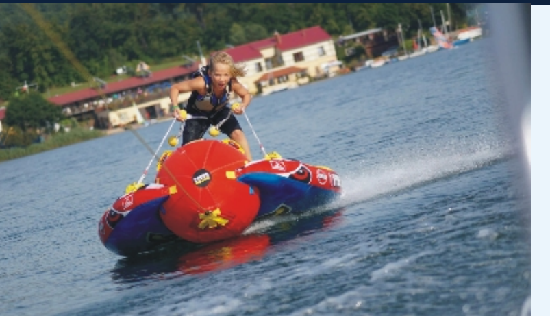
Wodne atrakcje w Ośrodku Kolonijnym Kadet-OK