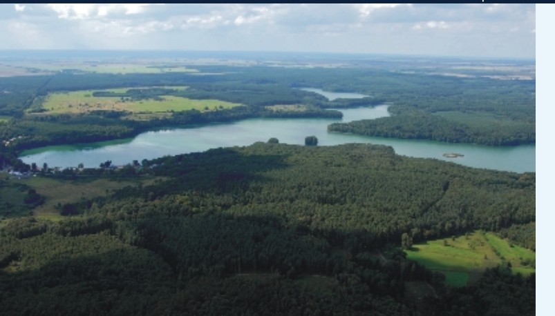
Lasy otaczające miejscowość Długie