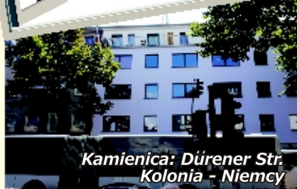
Kamienica: Dürener Str. Kolonia - Niemcy