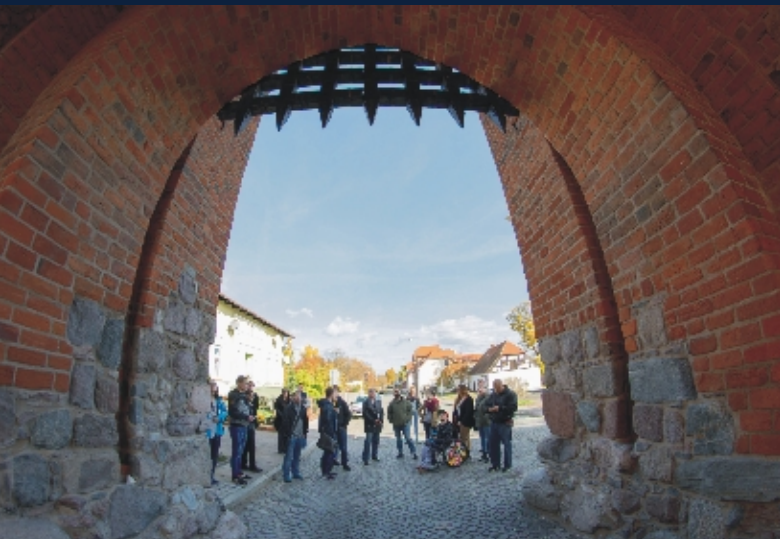
Brona w Bramie Młyńskiej