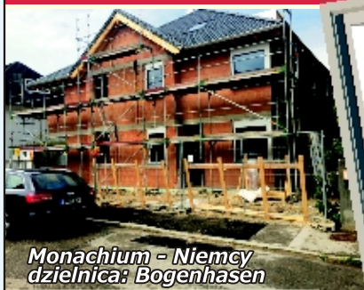
Monachium - Niemcy dzielnica: Bogenhasen