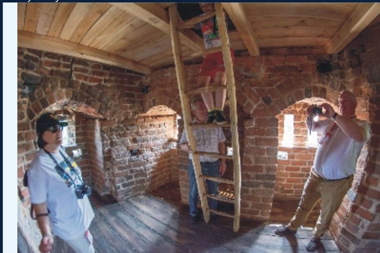
Wnętrze Baszty Więziennej

północnej zachował się dansker w formie wykusza. W latach 1915-1917 pomieszczenia bramne zostały adaptowane na muzeum regionalne, poprzez dodanie po stronie północnej ceglanego, modernistycznego budynku mieszczącego klatkę schodową. Realizacja została wykonana według projektu radcy budowlanego Hugo Prejawy ze Strzelec. W tym też czasie zabudowano znajdujący się po zewnętrznej stronie budynku bramnego pokład obronny. Natomiast osłaniający go krenelaż wykorzystano do wprowadzenia trzech otworów okiennych. Obecnie mieści się tutaj Państwowa Szkoła Muzyczna I Stopnia.