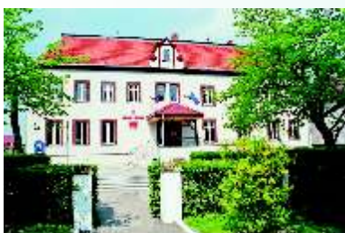
Budynek Urzędu Gminy w Kunicach

Budynek dawnego pałacu (z XVII w., mocno przebudowany w okresie późniejszym), obecnie nie jest wyremontowany. Przylega do niego niewielki park. Obecnie wieś liczy 1567 mieszkańców.