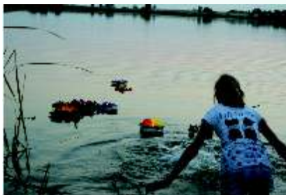
„Noc Świętojańska” w Jaškowicach Legnickich

każdego roku mieszkańcy gminy spotykają się na festynie „Noc Świętojańska”. Podczas festynu odbywają się konkursy, zabawy, uwieńczeniem wieczoru jest ognisko oraz puszczanie wianków na wodę.