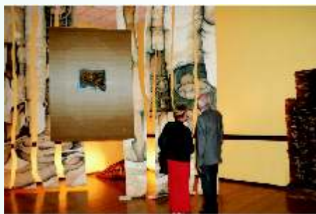
Wystawa tkaniny przestrzennej i gobelinu - GOKiS Kunice

Gminny Ośrodek Kultury i Sportu w Kunicach co roku organizuje świąteczne konkursy z nagrodami, np. konkurs szopek bożonarodzeniowych, wielkanocne malowanie jajek oraz konkurs stroików świątecznych.