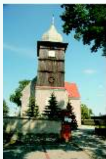
Kościół w Spalonej pw. Chrystusa Króla

Spalona – wieś położona przy drodze nr 94 z Legnicy do Prochowic, nad dużym zbiornikiem wodnym powstałym w wyniku eksploatacji żwirów. W 1418 r. występuje jako Heinersdorf (górnym i dolnym), w 1419 r. już jako Henrichsdorff, później jako Heinersdorf.