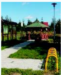
Ścieżka dydaktyczno-historyczna w Pątnowie Legnickim

Pątnów Legnicki – wieś położona na północny wschód od Legnicy. Wzmiankowana w 1417 r. jako Panthenaf, później również jako Panten lub Panthen. W XVIII było tu 40 domostw i 82 mieszkańców. Z tej wsi wywodzi się stary niemiecki ród von Rothkirch. Przed 1818 r. Pątnów należał do powiatu lubińskiego, później był domeną państwową, dzierżawioną przez radcę Theara. W XIX w. było tu 41 domów i 383 mieszkańców. Była też szkoła, klasycystyczny (z końca XVIII w.) pałac z parkiem krajobrazowym, folwark i karczma.