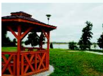
Jaśkowice Legnickie – park nad jeziorem