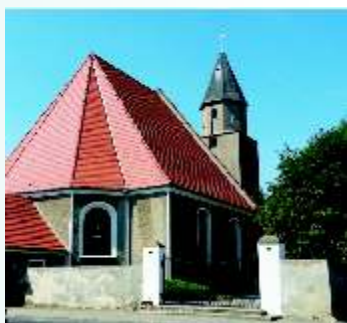
Kościół parafialny pw. Serca Jezusowego w Kunicach

Oddzielną częścią Kunic była również tzw. Seegasse, ulica Nadjeziorna z 12 domami, która najpóźniej została włączona w obręb wsi. We wsi była duża szkoła ewangelicka, dwór i pałac, dwa folwarki, dwie karczmy i dwa młyny wiatrowe. Hodowano owce (ok. 4000 merynosów). W zachodniej części wsi, na miejscu dawnego jeziora, wydobywano torf.