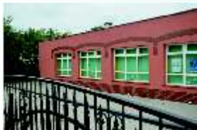
Świątelnica wiejska w Golance Górnej