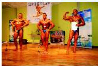
Zawody kultury i sportu „Herkules” 2013

Ogólnopolski Festiwal Piosenki Żeglarskiej „SZANTY”. Festiwal organizowany jest w Kunicach nad Jeziorem Kunickim od 1988 roku, corocznie w lipcu, na imprezę zjeżdżają żeglarze i miłośnicy piosenki żeglarskiej z całej Polski.