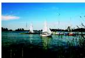
Widok na Jezioro Kunickie