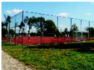
Zespół Sportowy w Bieniowicach