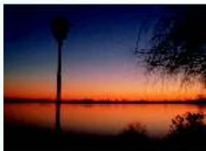
Zachód słońca nad Jeziorem Kunickim

Na terenie gminy znajdują się cenne obszary przyrodnicze: leśny rezerwat przyrody „Błyszcz” i „Ponikwa”, Torfowisko Kunice, użytek ekologiczny „Torfowisko Szczytniki”. W Pątnowie Legnickim wyznaczono obszar Natura 2000.