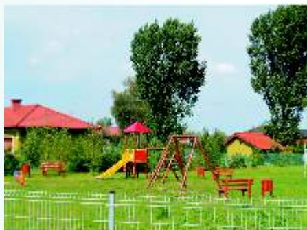
Plac zabaw – Szczytniki Małe