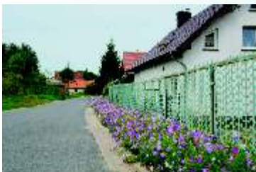
Widok na ulicę Piotrówka

Piotrówek – niewielka wieś usytuowana w południowo-wschodniej części gminy. Na jej terenie znajdują się zaledwie trzy obiekty o walorach kulturowych, w tym budynek folwarku z XIX w. Wieś została ponownie włączona do granic gminy Kunice stosunkowo niedawno, bo 1.01.2001 r. Obecnie wieś liczy 135 mieszkańców.