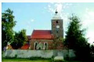
Rosochata - kościół pw. Wniebowzięcia NMP z XIV w.