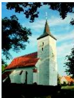
Kościół pw. św. Zofii w Grzybianach

Grzybiany – wieś położona w południowej części gminy nad Jeziorem Koskowskim. W 1363 r. wzmiankowana jako Griban, w 1432 r. jako Greybean lub Greibian, w 1477 r. - Greibnig. Natomiast po wojnie wrócono do polskiej nazwy – Grzybiany. W XIX w. wieś miała 68 domostw i 394 mieszkańców. Działała tu ewangelicka szkoła. We wsi były dwa wiatraki i tłocznia oleju. Była też karczma. Hodowano głównie merynosy.