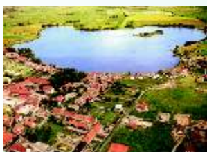
Kunice - widok z lotu ptaka

Lokalizacja wsi na prawie niemieckim miała miejsce w 1279 r. Do 1820 r. wieś należała do powiatu lubińskiego. W XIX wieku Bieniowice liczyły