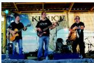
Ogólnopolski Festiwal Piosenki Żeglarskiej „Szanty” Kunice – 2013

Ogólnopolskie Zawody Kultury i Sportu „HERKULES” – organizowane w Gminnym Ośrodku Kultury i Sportu w Kunicach od 1997 roku.