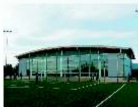
Hala sportowo-widowiskowa w Spalonej