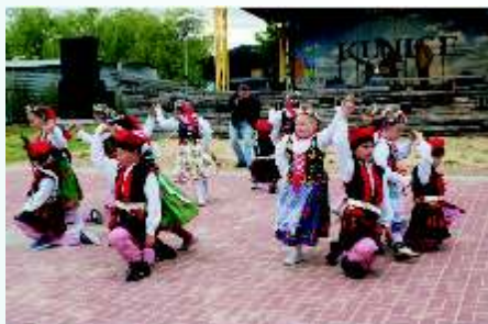
Majówka – Kunice 2013

Na terenie gminy w poszczególnych sołectwach co roku w maju organizowane są festyny dla mieszkańców gminy – tzw. Majówki, w których uczestniczą nie tylko miejscowi, ale również goście z sąsiednich gmin oraz pobliskich miast, np. Legnicy.