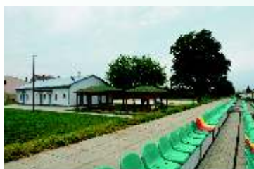
Boisko piłkarskie w Rosochatej