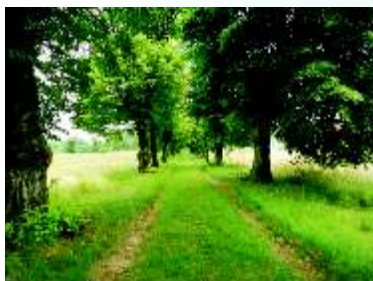
Aleja lipowa w Szczytnikach nad Kaczawą

Wieś położona przy drodze Legnica – Bieniowice – Prochowice, na krawędzi Wysoczyzny Lubińskiej. Około 1305 r. wzmiankowana jako Syldar, w 1413 r. jako Grossen Schildern lub Schildern-Polnisch, później używano skróconej nazwy Pohlschildern. Po wojnie początkowo wieś nosiła nazwę Polany, dopiero później zmieniono ją na Szczytniki. Nazwa wsi świadczy o jej dawnym charakterze