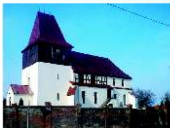
Miłogostowice – kościół pw. św. Stanisława

Wzniesiony w XV w. kościół filialny św. Stanisława w późniejszym czasie wielokrotnie był przebudowywany. Na jego wystrój składają się m.in. późnorenesansowy ołtarz i drewniana ambona (z tego samego okresu). Dzwon na wieży kościelnej pochodzi z 1658 r. Obecnie wieś liczy 294 mieszkańców.